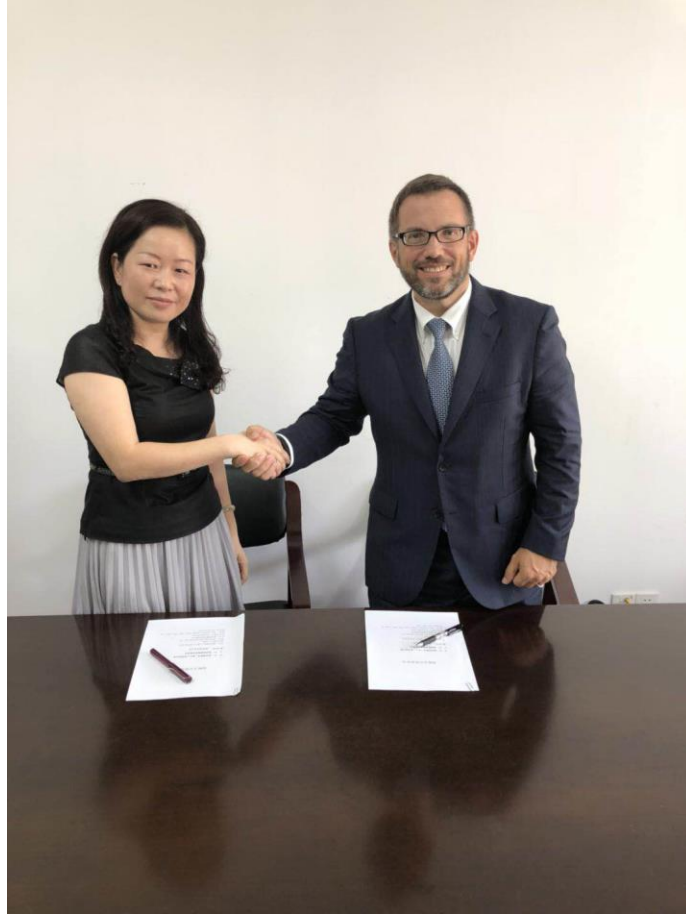
圖 3: 歐夏律師和湯局長在簽完協議後握手